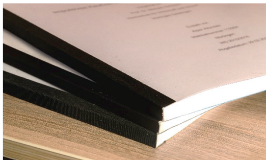
Kaltklebebindung in eigener Herstellung