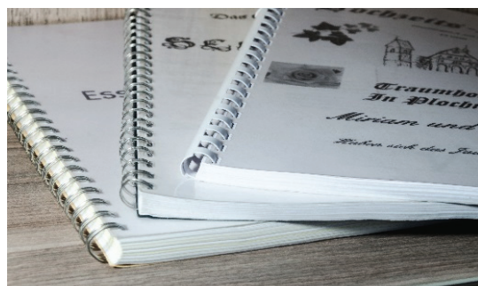
Ringbindungen in Plastik & Metall

eigene Herstellung - Ringbindungen in Plastik und Metall